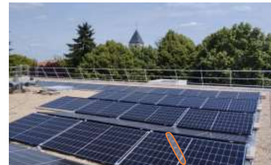
Diverses communes de l'Essonne

Projets de PV toiture et ombrière (24-25)