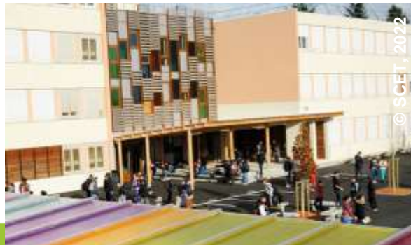
Collèges – CD 91

Projets de PV toiture et ombrière (24-25)