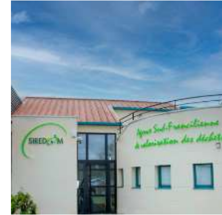
Siège - SIREDOM