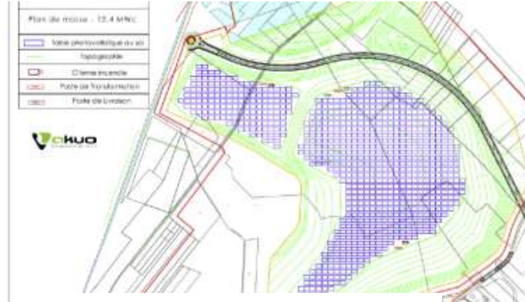
Ferme solaire - commune