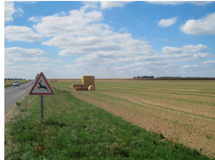
La grande couronne oubliée ?