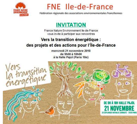
La transition énergétique en lien avec FNE-IDF